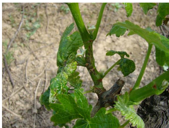
Fotos de escoriose, na vara e folha.

Devido o Sr. Agricultor contactar a Estação de Avisos para qualquer esclarecimento adicional.