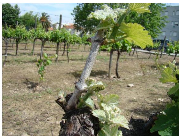
Fotos de escoriose, na vara do ano anterior.